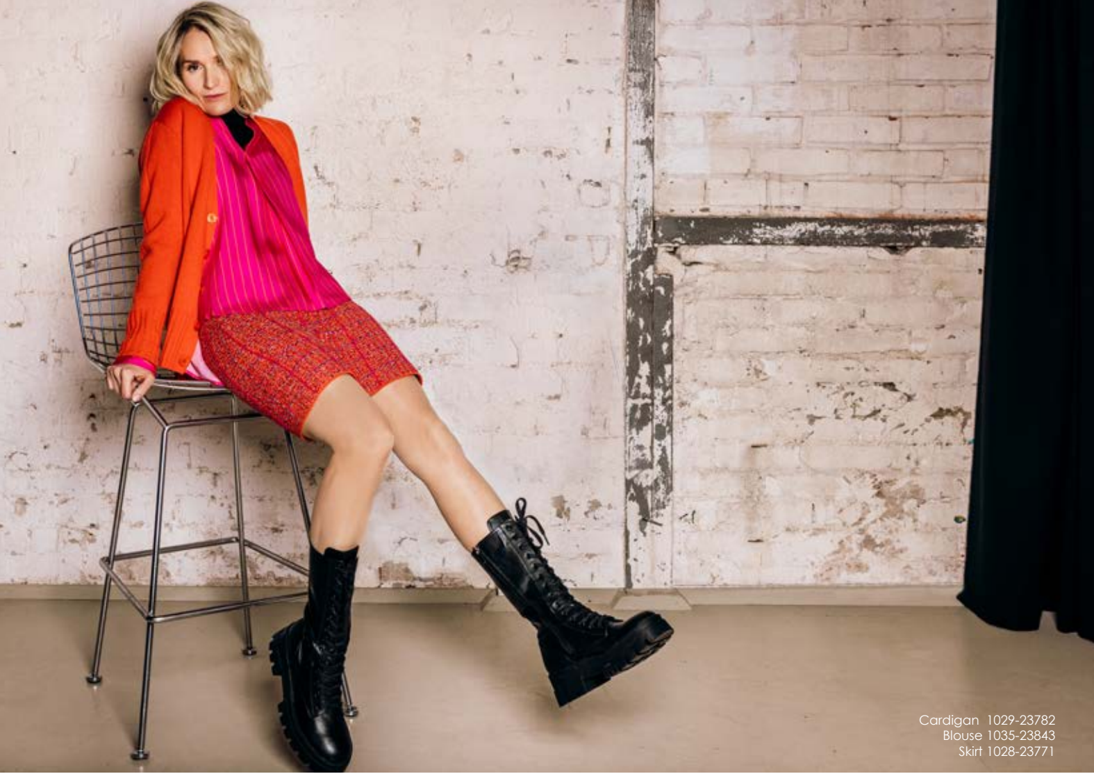
Cardigan 1029-23782 Blouse 1035-23843 Skirt 1028-23771