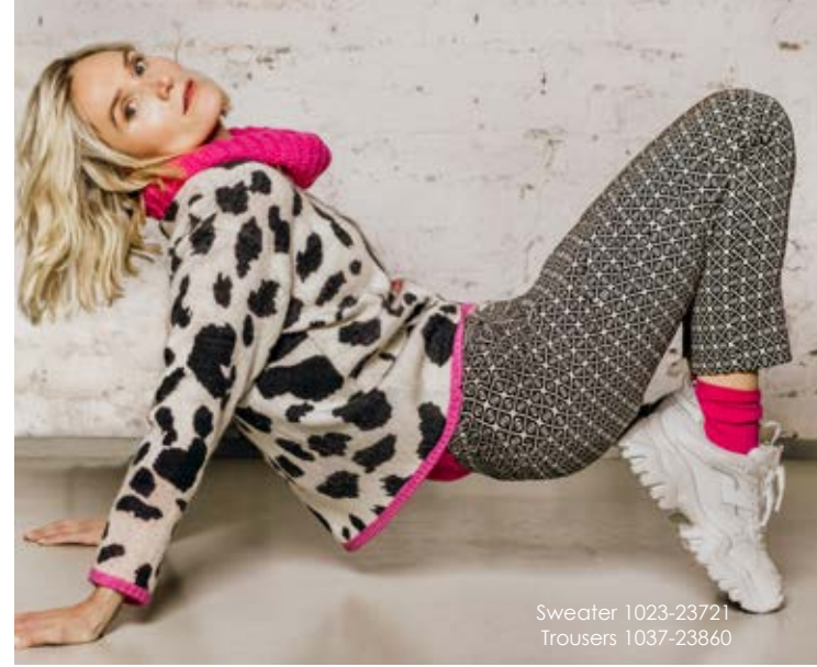
Sweater 1023-23721 Trousers 1037-23860