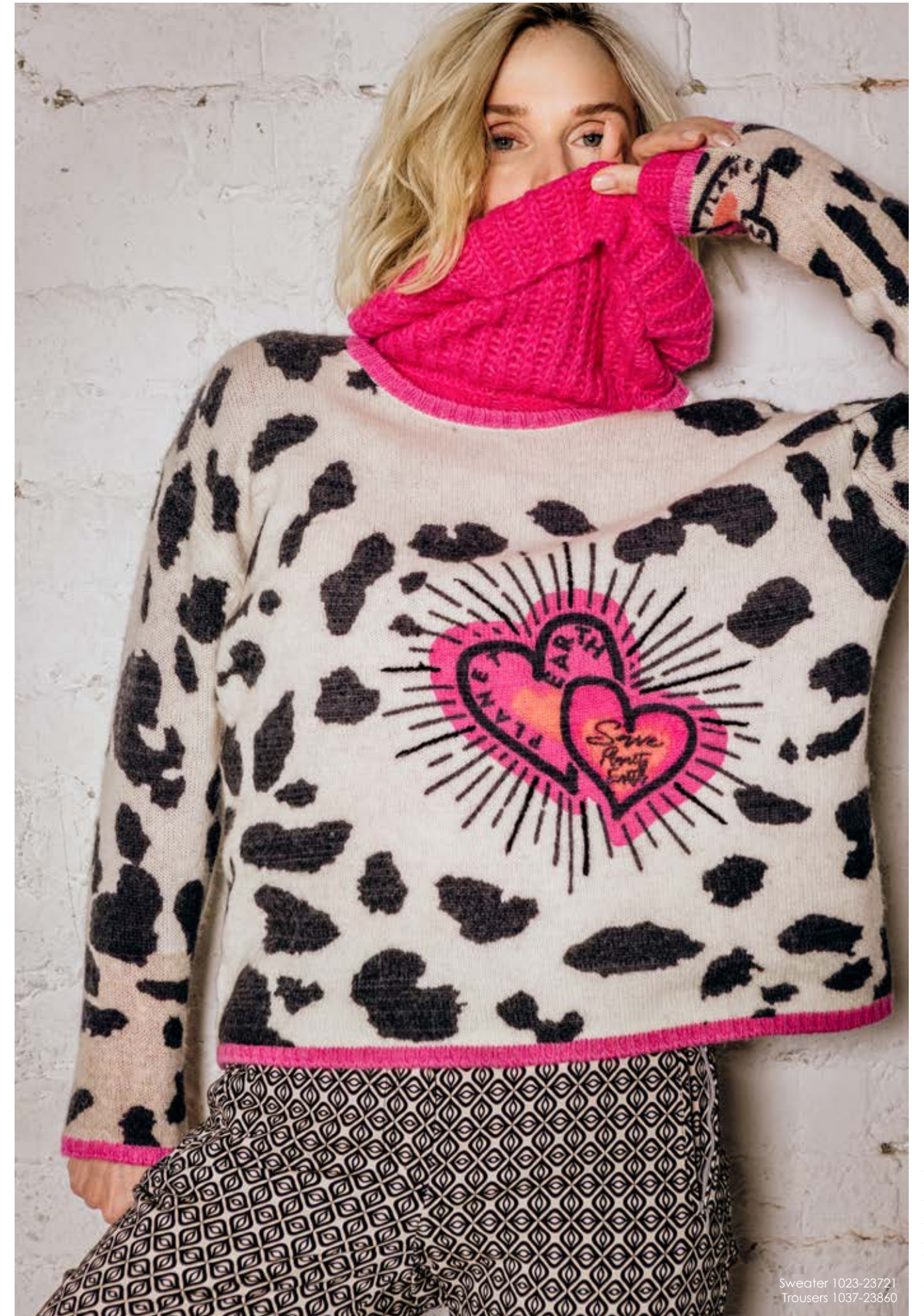
Sweater 1023-23721 Trousers 1037-23860