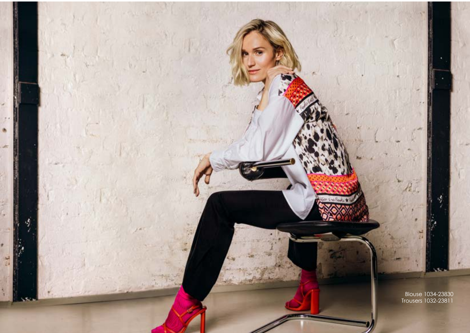
Blouse 1034-23830 Trousers 1032-23811