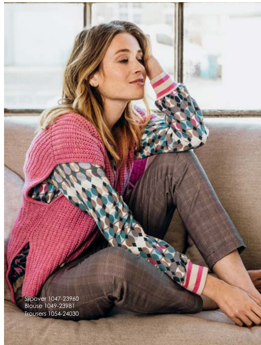
Slipover 1047-23960 Blouse 1049-23981 Trousers 1054-24030