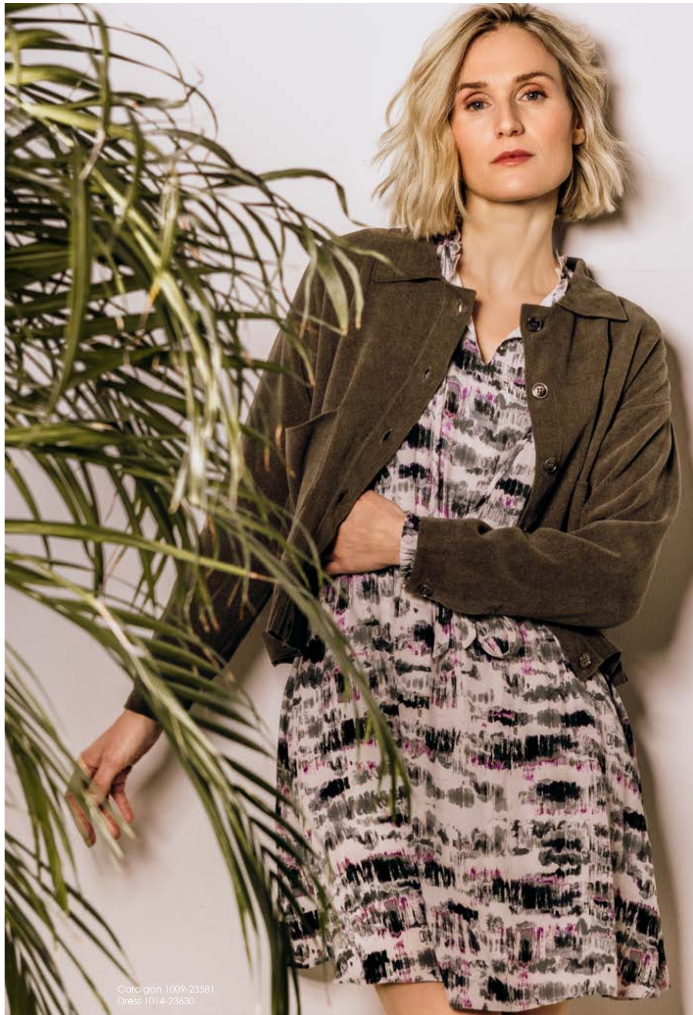
Cardigan 1009-23581 Dress 1014-23630