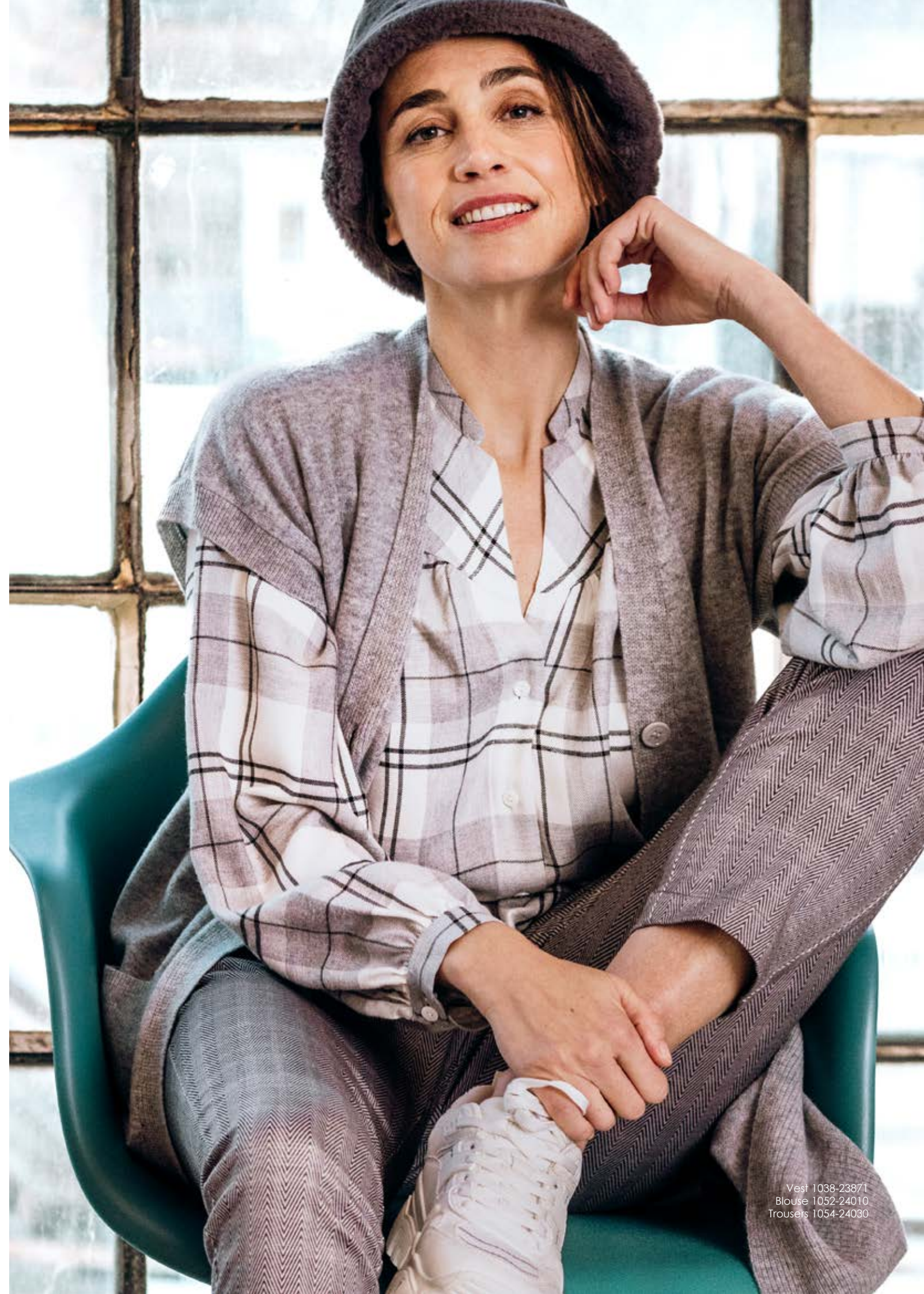
Vest 1038-23871 Blouse 1052-24010 Trousers 1054-24030