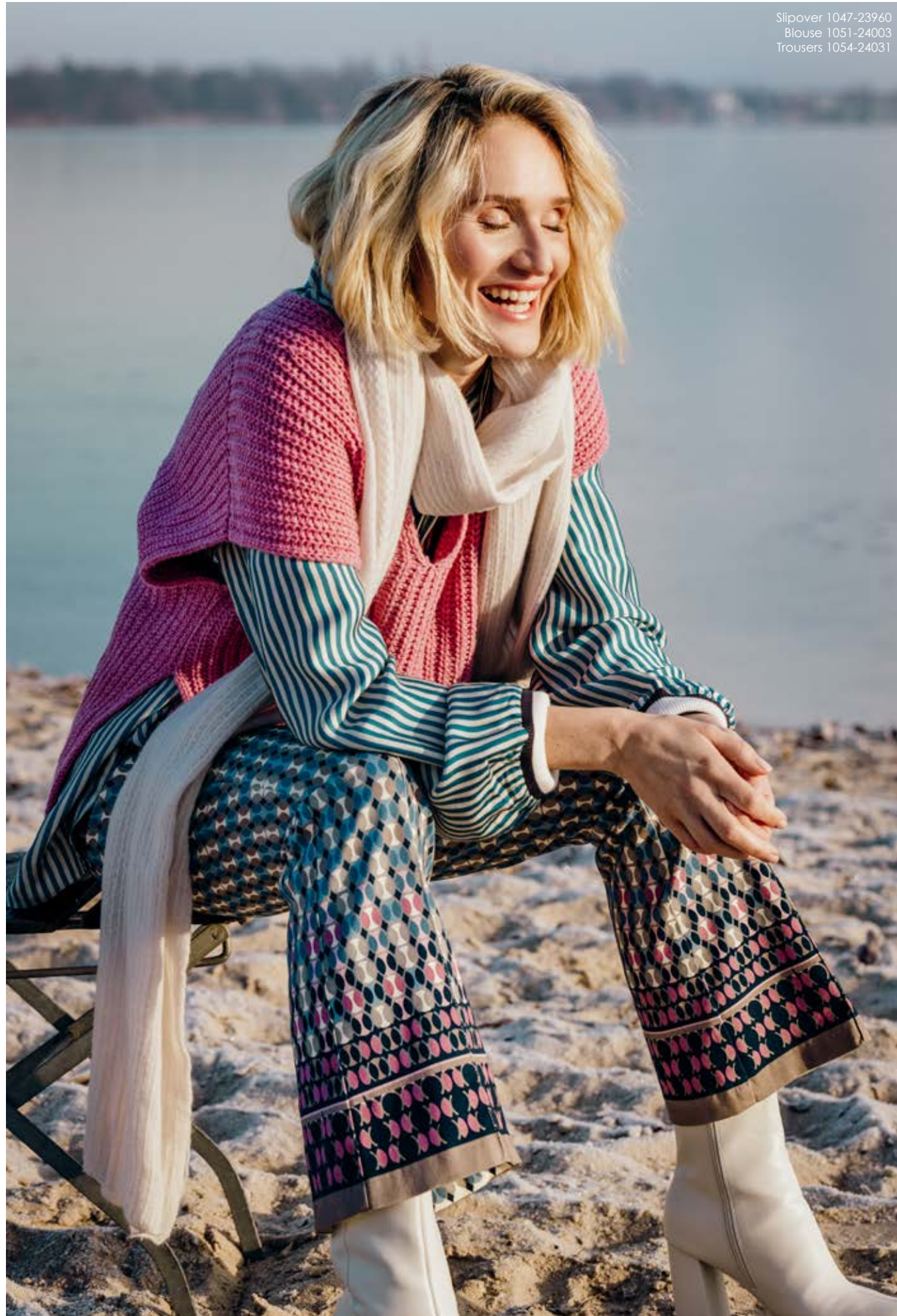
Slipover 1047-23960 Blouse 1051-24003 Trousers 1054-24031