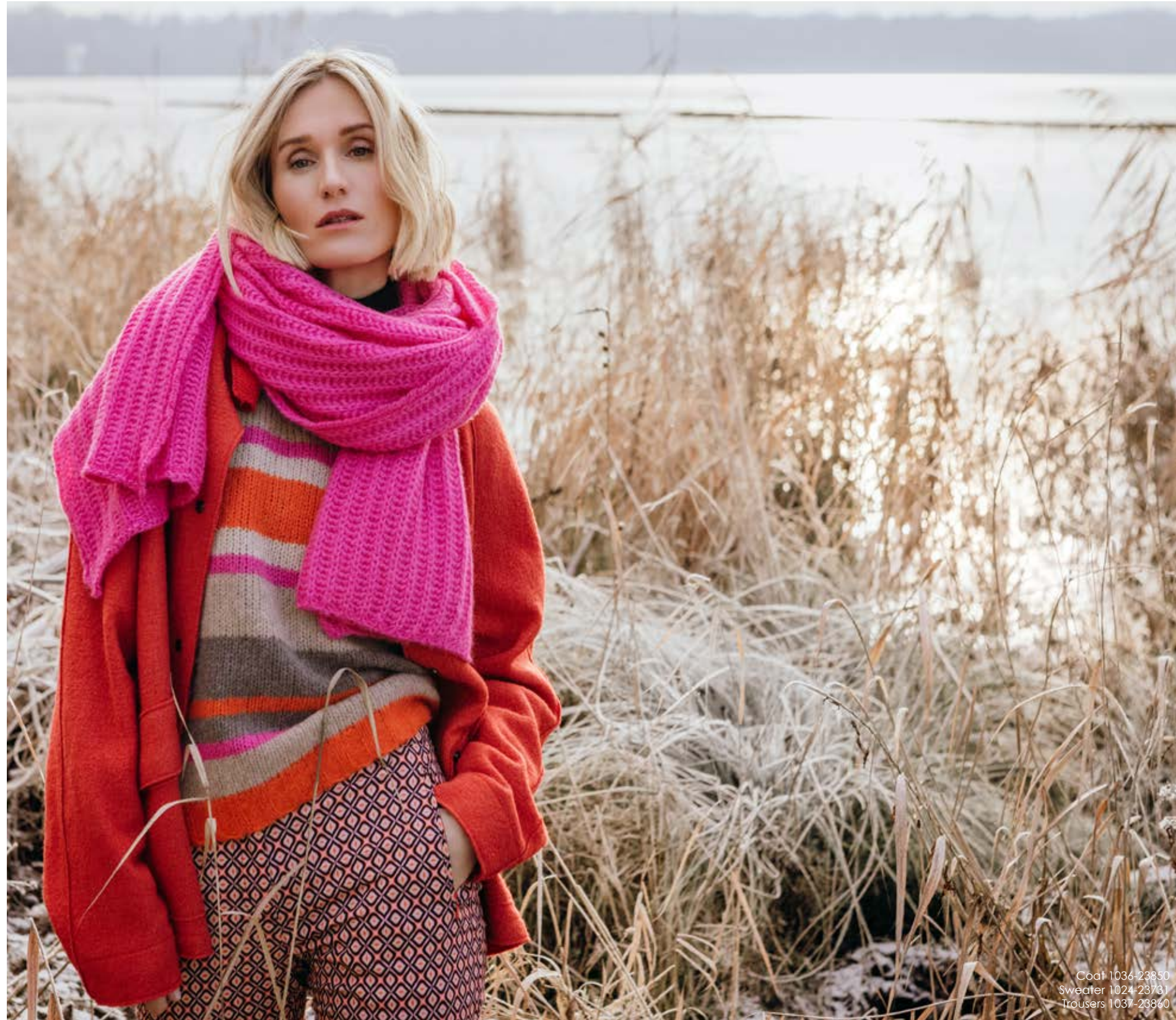
Coat 1036-23850 Sweater 1024-23731 Trousers 1037-23840

Im Vordergrund unseres farblich intensivsten Kollektionsthemas „Global Adventures“, steht die Strahlkraft, welche die Natur im Herbst mit sich bringt. Leuchtende Farben wie Chili und Pink werden mit neutralen Farben wie Sand und Creme kombiniert und erwecken somit die Lebensfreude auch an trüben Herbsttagen. Die Kombination aus abstrakten Mustern und neuen Silhouetten ermöglicht eine unkomplizierte Wandelbarkeit. | The focus of our most color-intensive collection theme, "global adventures", is the radiance that nature brings with it in autumn. Bright colors, such as chili and pink are combined with neutral colors, like sand and cream, and thus awaken the joy of life even on gloomy autumn days. The combination of abstract patterns, with new silhouettes allows for uncomplicated changeability.