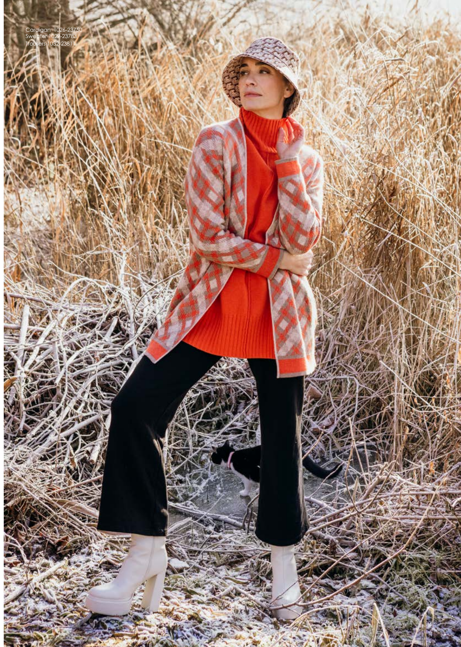
Cardigan 1026-23750 Sweater 1029-23783 Trousers 1032-23811