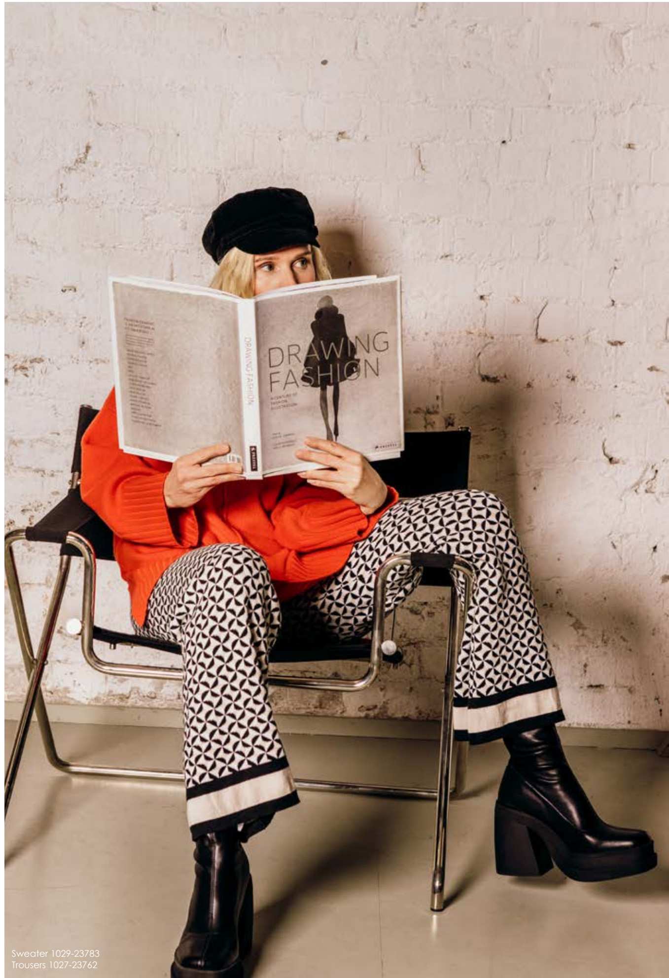
Sweater 1029-23783 Trousers 1027-23762