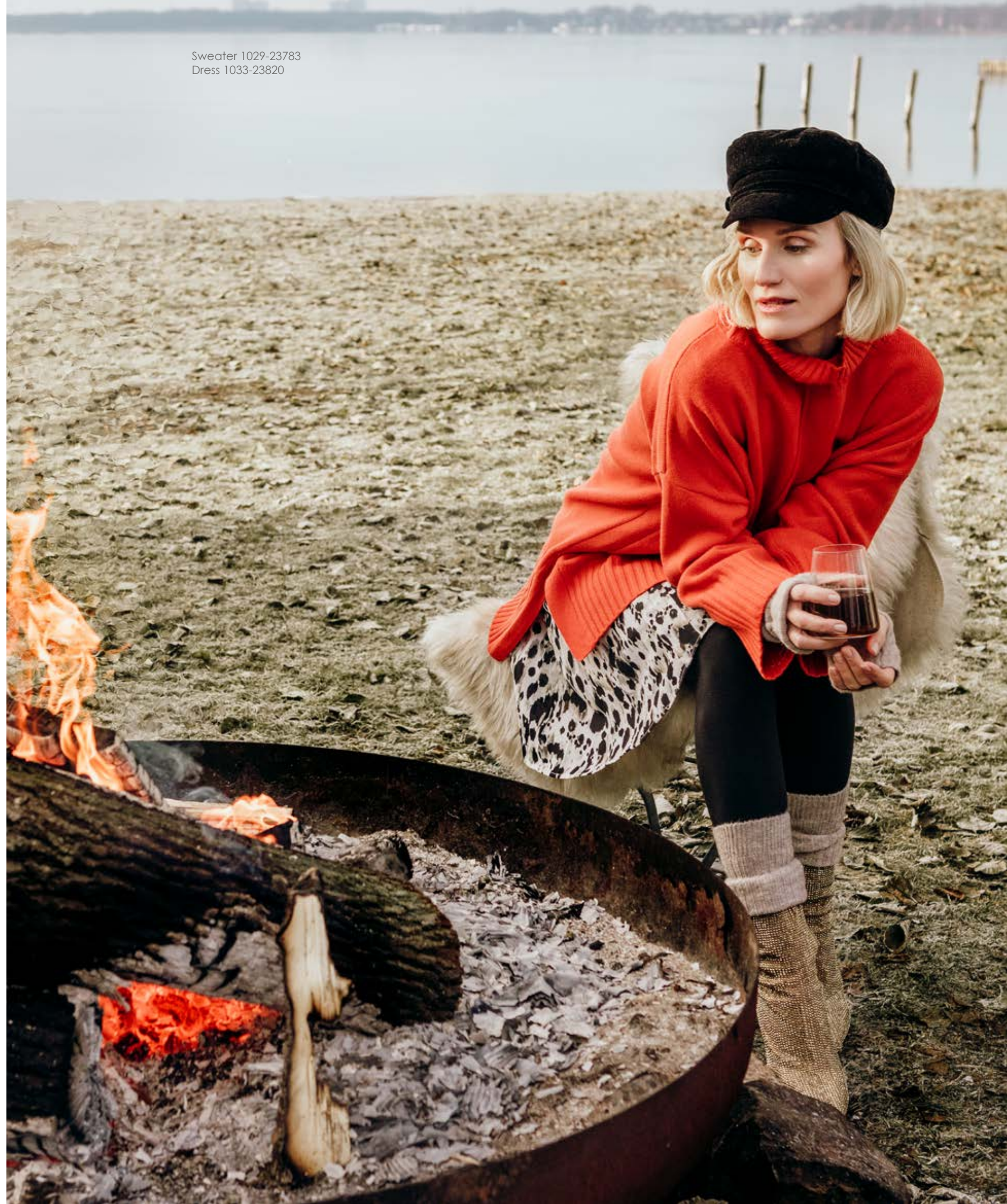
Sweater 1029-23783 Dress 1033-23820