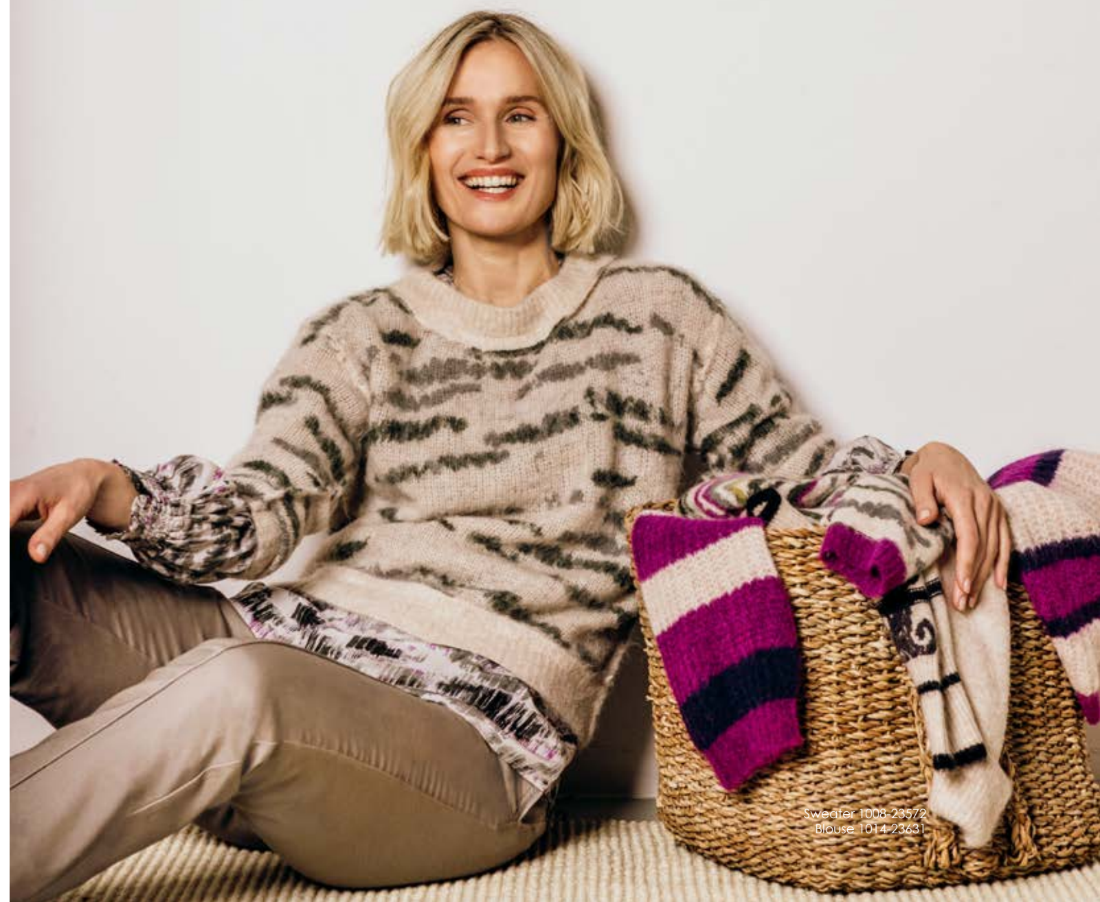
Sweater 1008-23572 Blouse 1014-23631