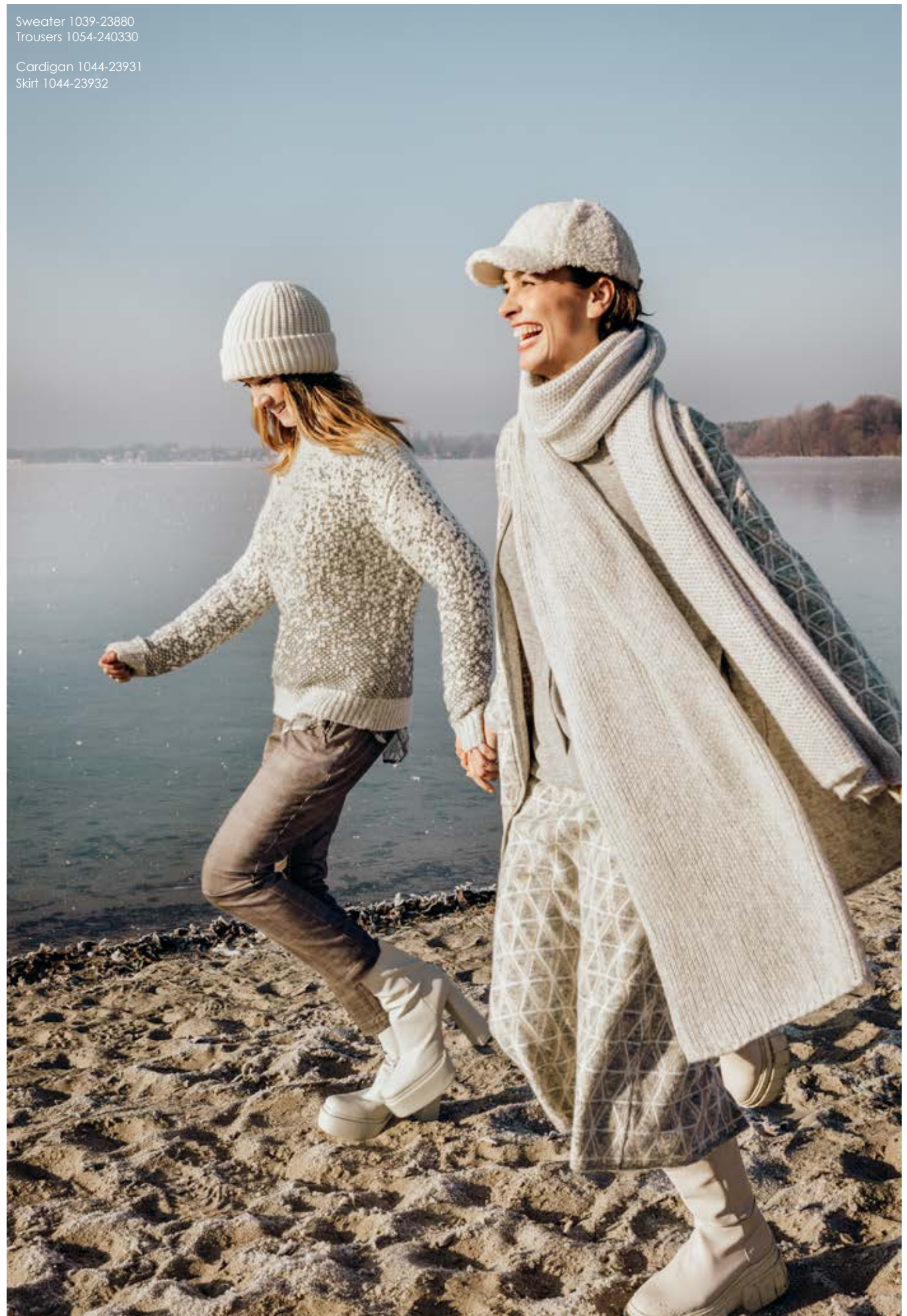
Sweater 1039-23880 Trousers 1054-240330 Cardigan 1044-23931 Skirt 1044-23932