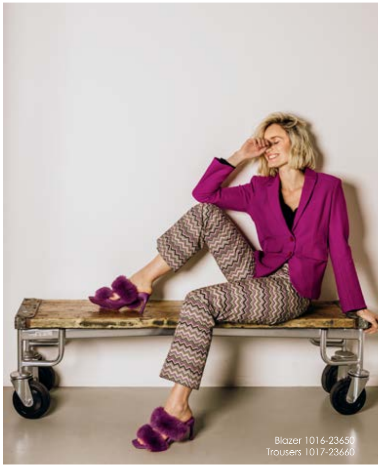
Blazer 1016-23650 Trousers 1017-23660