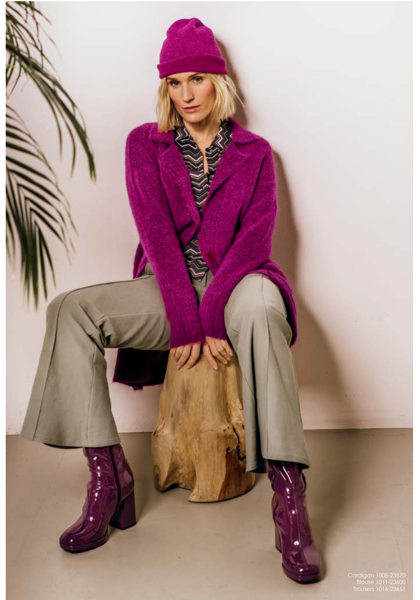
Cardigan 1008-23570 Blouse 1011-23600 Trousers 1016-23651