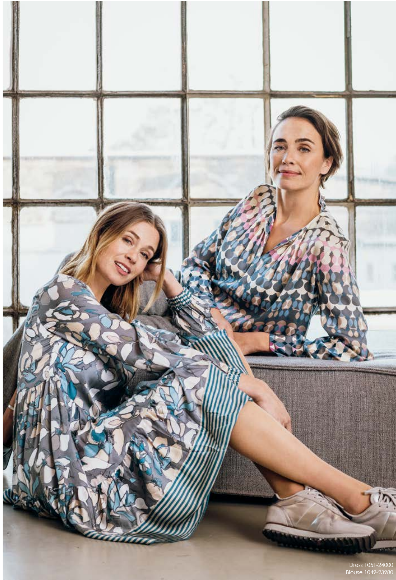
Dress 1051-24000 Blouse 1049-23980